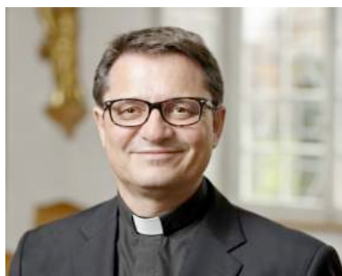
Felix Gmür, Bischof von Basel

«Wir unterstützen das Kantonslager 2020 unabhängig von Parteizugehörigkeiten – für einmal sind wir uns alle einig!»