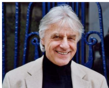
Emil Steinberger, Kabarettist

«In der Jubla betätigen sich Kinder und Jugendliche polysportiv in der Natur. Deshalb unterstütze ich das Kantonslager 2020»